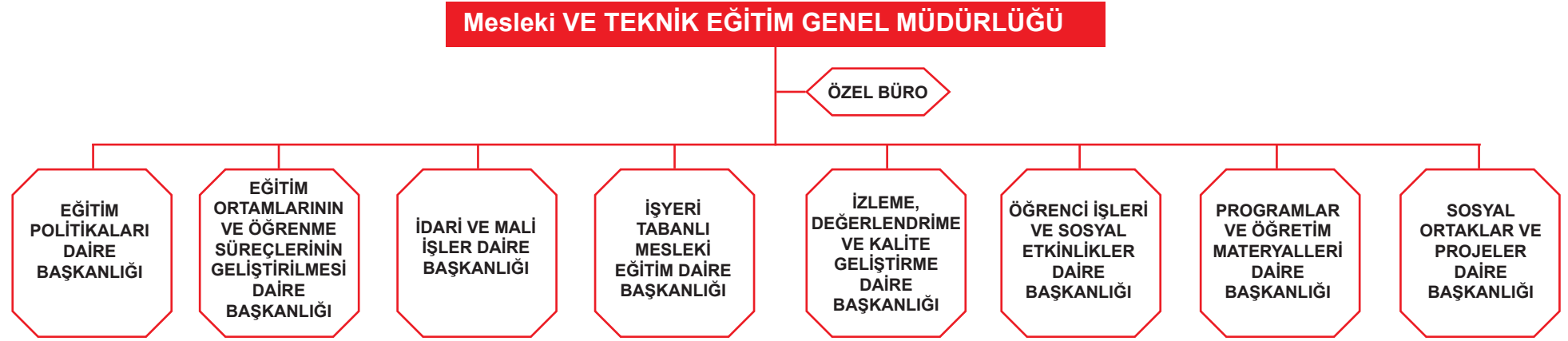
Şekil 1 : Birim Teşkilat ve Organizasyon Yapısı