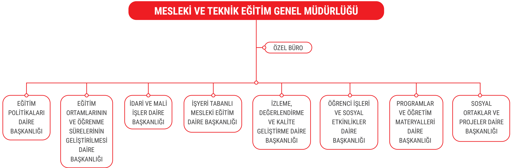
Şekil 1: Birim Teşkilat ve Organizasyon Yapısı