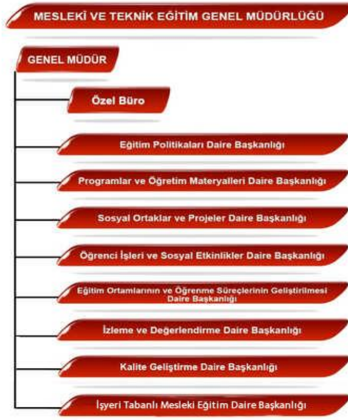
Şekil 1: Mesleki ve Teknik Eğitim Genel Müdürlüğü Teşkilat ve Organizasyon Yapısı